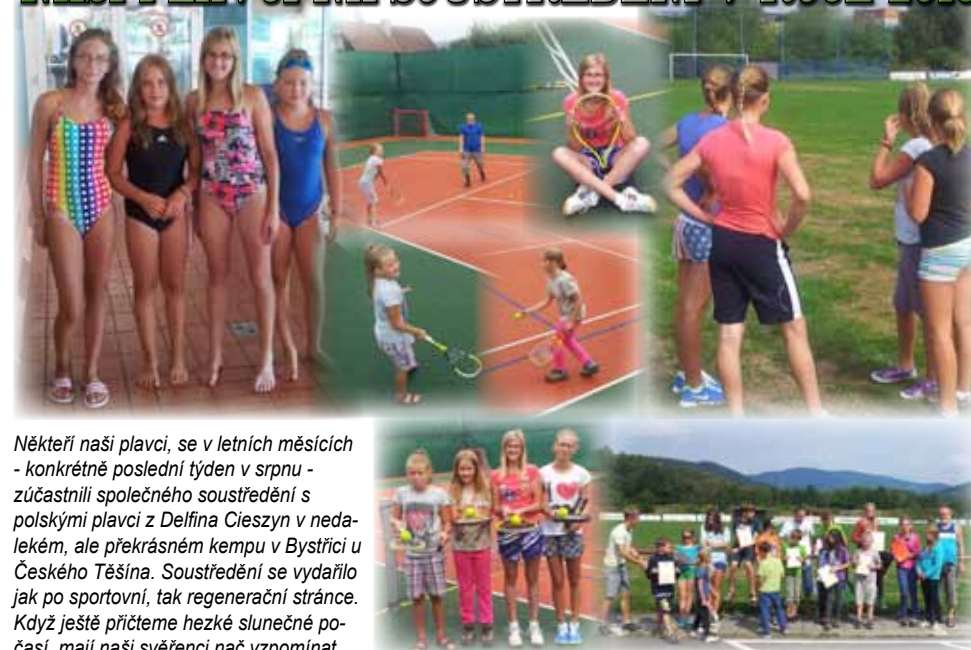
Někteří naši plavci, se v letních měsících - konkrétně poslední týden v srpnu - zúčastnili společného soustředění s polskými plavci z Delfina Cieszyn v nedalekém, ale překrásném kempu v Bystřici u Českého Těšína. Soustředění se vydařilo jak po sportovní, tak regenerační stránce. Když ještě přičteme hezké slunečné počasí, mají naši svěřenci nač vzpomínat.