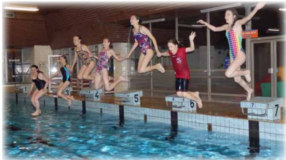
Evidentně čistá radost z právě skončených a úspěšných závodů v podání plavkyň našeho oddílu...